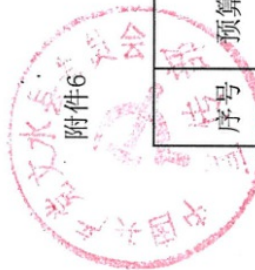
2023年预算整体支出绩效目标完成情况汇总表