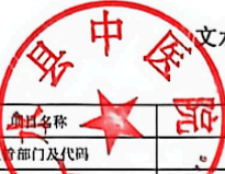
文水县城(区)级预算部门(单位)项目支出绩效目标表